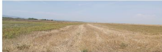
Fig. 2 Fotografi nga terreni

AGJENCIA KOSOVARE E PRIVATIZIMIT KOSOVSKA AGENCIJA ZA PRIVATIZACIJU PRIVATISATION AGENCY OF KOSOVO