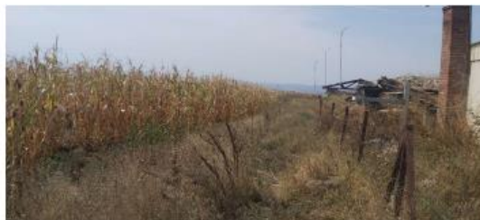
Fig. 2 Fotografji nga terreni

AGJENCIA KOSOVARE E PRIVATIZIMIT KOSOVSKA AGENCIJA ZA PRIVATIZACIJU PRIVATISATION AGENCY OF KOSOVO