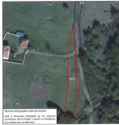
Fig.1 Ortofoto, parcela kadastrale 178-0 ZK Zhub, K.Gjakovë

Toka është e regjistruar në certifikatën e pronësisë, parcela kadastrale me nr të njësisë P-70705033-00178-0 me sipërfaqe 1358m 2 me kulturë Kullosë e klasës 4 1/1 në vendin e quajtur "Kodra Kabash".