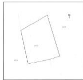
Ortofoto dhe kopja e planit për parcelën nr.227-19 z.k Kosh, Komuna e Istogut.

Nga vizita jonë në terren konstatuam se :