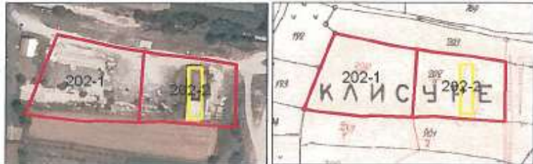
Ortofoto dhe plani kadastral në z.k Kramovik, Komuna e Rahovecit

Depo shtrihet në parcelën nr.202-2 z.k Kramovik.