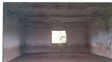
Pamje e Depos në parcelën nr.202-2