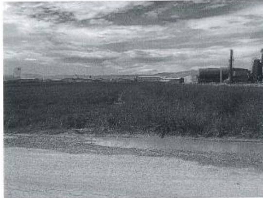
Fig. 2 Fotografi nga terreni

AGJENCIA KOSOVARE E PRIVATIZIMIT KOSOVSKA AGENCIJA ZA PRIVATIZACIJU PRIVATISATION AGENCY OF KOSOVO