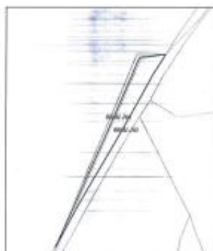
Ortofoto dhe kopja e planit për parcelën nr.1-166 z.k Potërq i poshtëm, Komuna e Klinës.

Nga vizita jonë në terren konstatuam se :