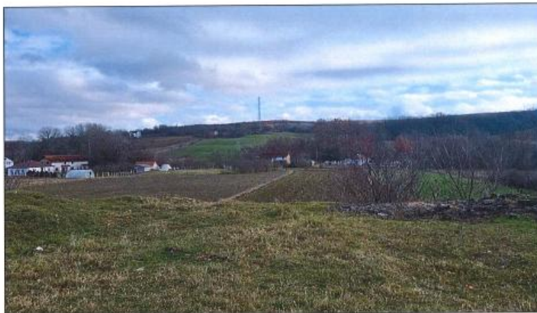
Pamje e parcelës nr.199-3 z.k Dranashiq, Klinë.

Fotografia e mëposhtme prezanton gjendjen e parcelës nr.199-3 z.k Dranashiq, Klinë: