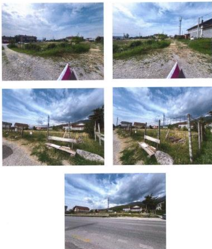
Fig. 2 Fotografitë e mëposhtme paraqesin gjendjen faktike në terren:

AGJENCIA KOSOVARE E PRIVATIZIMIT KOSOVSKA AGENCIJA ZA PRIVATIZACIJU PRIVATISATION AGENCY OF KOSOVO