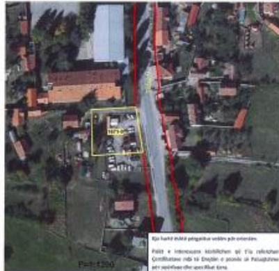
Fig.1 Ortofoto, parcela kadastrale 1671-0 ZK Strellc i Epërm

Toka është e regjistruar në certifikatën e pronësisë, parcela kadastrale me nr të njësisë P-70511022-01671-0 me sipërfaqe 1525m 2 me kulturë Livadh i klasës 4/Tokë ndërtimore/Oborr 1/1 në vendin e quajtur "Strellc i Epërm".