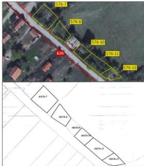
Ortofoto dhe kopjet e planit për parcelat e lartëcekura në z.k Videjë, Komuna e Klinës.

Parcela nr.576-7 ka sipërfaqe prej 435 m 2 me kulturë : bujqësore, kullosë e klasës 1; Parcela nr.576-8 ka sipërfaqe prej 258 m 2 me kulturë : bujqësore, kullosë e klasës 2; Parcela nr.576-10 ka sipërfaqe prej 197 m 2 me kulturë : bujqësore, kullosë e klasës 2; Parcela nr.576-11 ka sipërfaqe prej 360 m 2 me kulturë : bujqësore, kullosë e klasës 2; Parcela nr.576-12 ka sipërfaqe prej 175 m 2 me kulturë: bujqësore, kullosë e klasës 2.