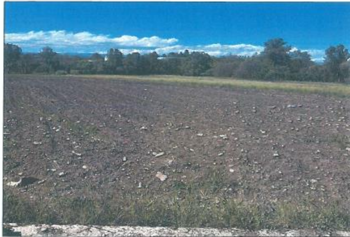
Pamje e parcelës nr.97-2 z.k Gjurjevik, Klinë

Fotografia e mëposhtme prezanton gjendjen faktike në terren :